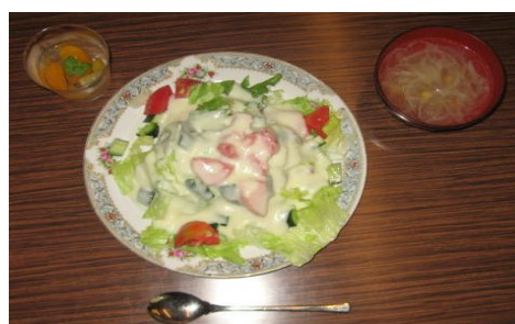
BSG1ライスとビーバーたち手作りのデザート(左上)