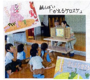
隊長夫妻の紙しばい