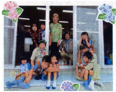
公民館でビーバーとり作り