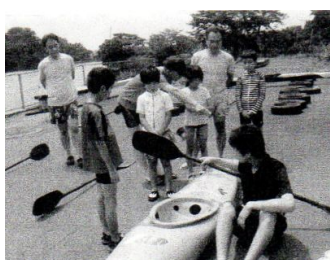
カブ隊のカヌー体験(神埼B & Gセンター)