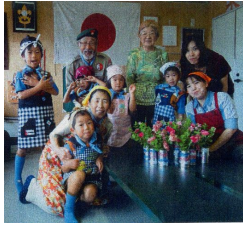
スカウトハウスでフルーツゼリー作り